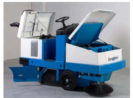
Wartungsarbeiten in kürzester Zeit dank wartungsoptimiertem Aufbau der einzelnen Komponenten.