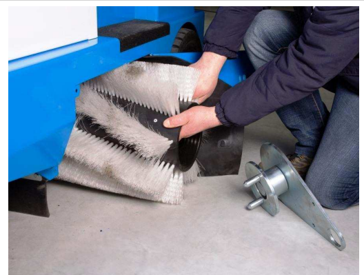
Hoher Qualitätsstandard für industriellen Einsatz. Höchste Effizienz, Wechsel der Hauptkehrwalze ohne Werkzeug spart Kosten und Zeit.