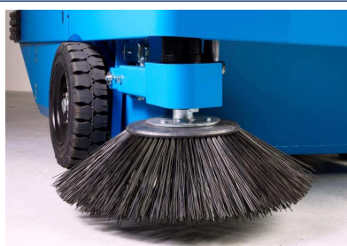
Effizient, übersichtlich und robust. Konzipiert für schweren industriellen Einsatz.