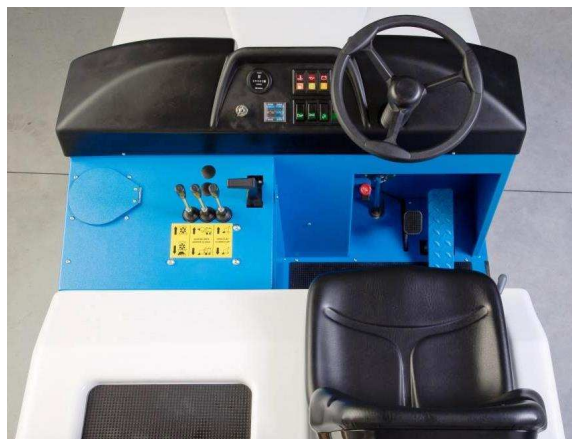
Anwenderfreundliches Bedienpult, alle Funktionen auf einen Blick. Übersicht und Ergonomie für einen angenehmen Arbeitsplatz.