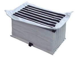
Polyester Vlies Taschenfilter

Ing.O.Fiorentini S.p.A. – Repräsentanz Deutschland Oberes Bratfeld 16 91632 Wieseth