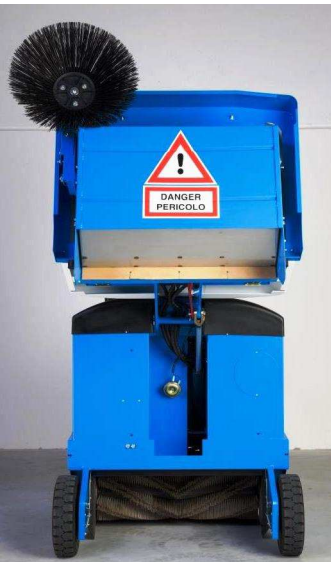
Funktionalität bis ins Detail, effizient, übersichtlich und robust. Ausgelegt auf industriellen Einsatz. Hochentleerung auf 134 cm Höhe.