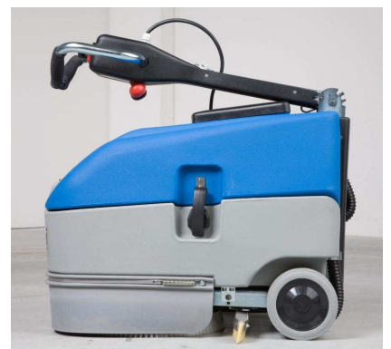
einfacher Transport auch im PKW dank klappbarem Bügelgriff.