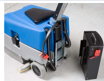
Schneller und einfacher Batteriewechsel dank Batteriebox.