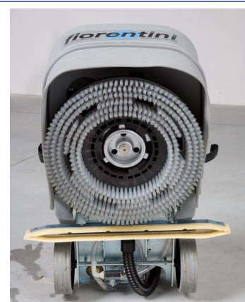
Dank der Abklippfunktion ist ein einfaches wechseln der Bürste oder Padhalter möglich.

Ing.O.Fiorentini S.p.A. – Repräsentanz Deutschland Oberes Bratfeld 16 91632 Wieseth