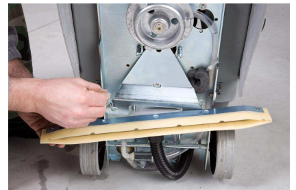
Einfach zu entnehmende Absaugleiste für schnelle Reinigung und einfachen Wechsel der Absauggummis.