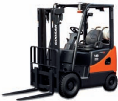
D15S / D18S-5 & D20SC-5 G15S / G18S-5 & G20SC-5 1,500kg 1,750kg 2,000kg Diesel und Treibgas