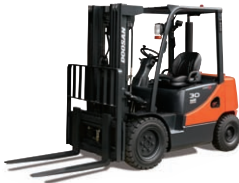
D20S / D25S / D30S / D33S-5 & D35C-5 G20E / G25E / G30E-5 G20P / G25P / G30P / G33P-5 & G35C-5 2,000kg 2,500kg 3,000kg 3,300kg 3,500kg Diesel und Treibgas