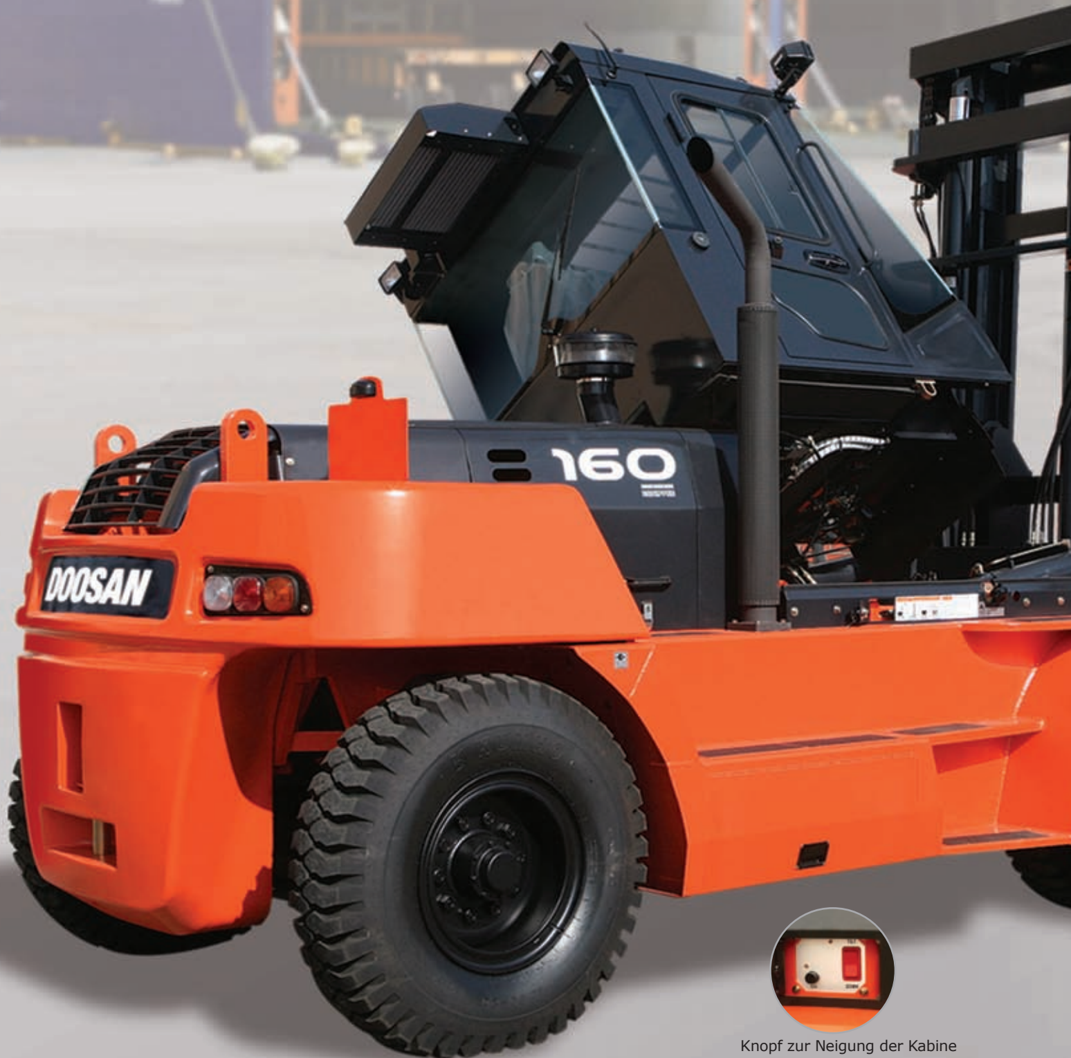
Knopf zur Neigung der Kabine