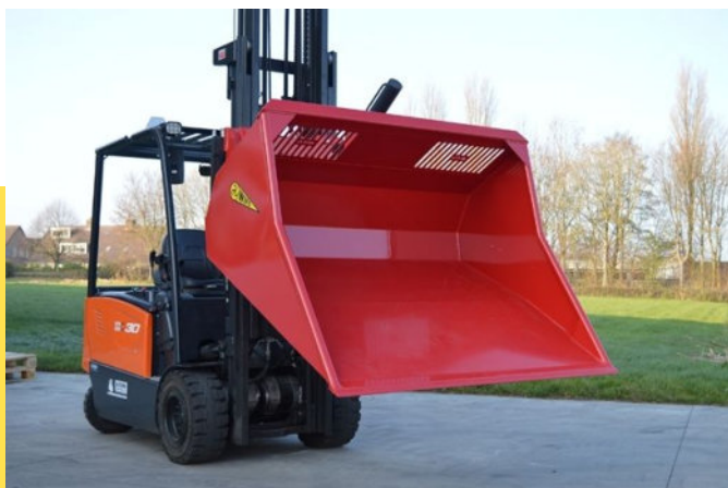
WIFO aardappelschapbak op vorkenbord

Alle Preise verstehen sich zzgl. der gesetzlichen MwSt., ab Lager