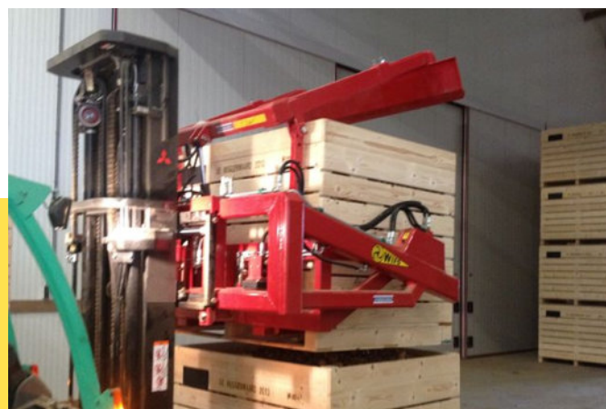
WIFO K85 voorover kantelaar