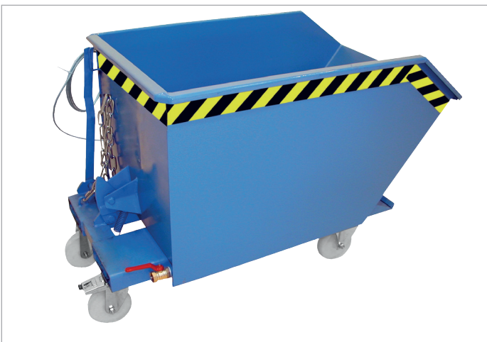
SGU mit Rollen