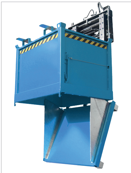
FB mit Zentrierwänden