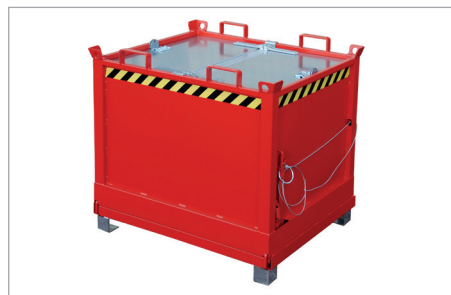
FB mit Deckel