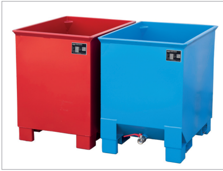
C 30 und CS 30