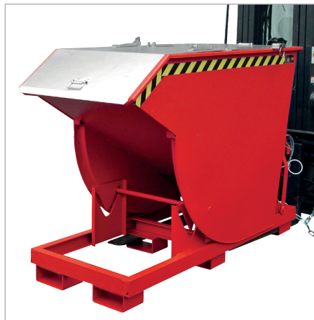
BKM mit Deckel