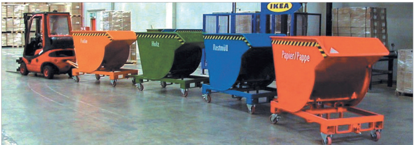
BKM mit Rollen und Anhängervorrichtung mit Deichsel