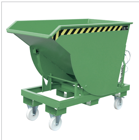
BKM mit Rollen