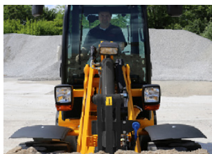
Der Fahrer hat einen guten Blick auf das Anbaugerät.