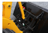
Mit der Werkzeugaufnahme „SWH“ lassen sich alle Anbauwerkzeuge schnell an- und abkoppeln. Die Hydraulische Verriegelung ist serienmäßig.