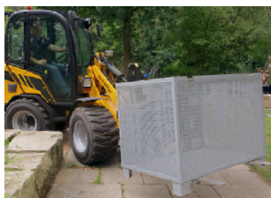
Wendigkeit ist Trumpf!