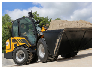
Die kompakten Kraftpakete sind auf allen Baustellen zu Hause.

Der Schäffer 2445 ist innerhalb seiner Klasse einer der leistungsstärksten Lader. Eine Pflastersteinpalette mit 1,6 t kann mit diesem Lader auch im unwegsamen Gelände sicher transportiert werden. Das Umsetzen zur nächsten Baustelle kann bei einem Einsatzgewicht ab 2,5 t auch mit einem PKW Anhänger erfolgen. Gerade für den Garten- und Landschaftsbau ist der vergleichsweise niedrige Bodendruck ein weiterer Vorteil.