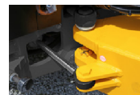
Das Knick-Pendelgelenk ist wartungsfrei und mit einer erweiterter Werksgarantie ausgestattet.