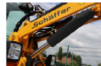
Der Hubzylinder wurde entsprechend der hohen Kipplast besonders stark dimensioniert. Kugelgelenkswagen schützen vor Torsion.