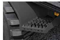
Die herausgezogene Trittsstufe erleichtert den Aufstieg enorm.