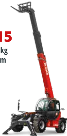
Deutz 55,4 kW (75,3 PS) bei 2.200 U/min