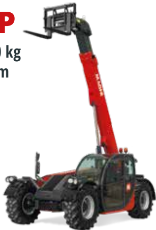
Deutz 74,4 kW (101,2 PS) bei 2.200 U/min