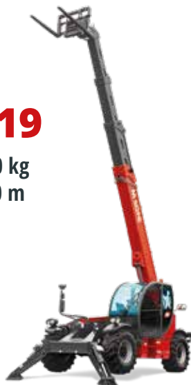
Deutz 55,4 kW (75,3 PS) bei 2.200 U/min