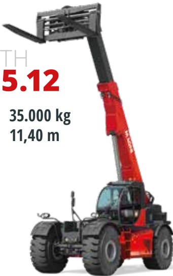
Volvo 250 kW (340 PS) bei 2.200 U/min