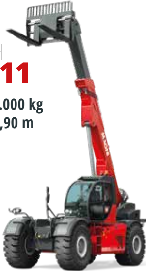
Volvo 175 kW (238 PS) bei 2.300 U/min