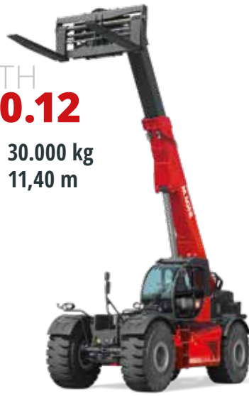
Volvo 235 kW (320 PS) bei 2.200 U/min