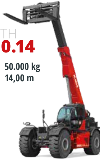
Volvo 235 kW (320 PS) bei 2.200 U/min