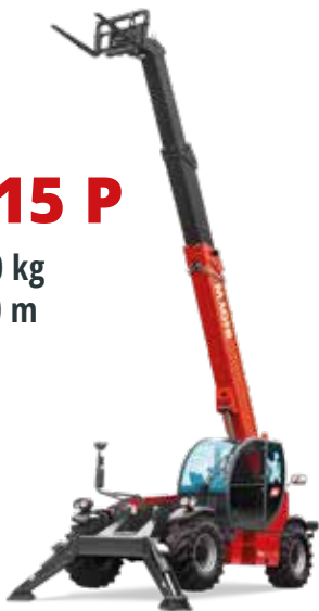
Deutz 74,4 kW (101,2 PS) bei 2.200 U/min